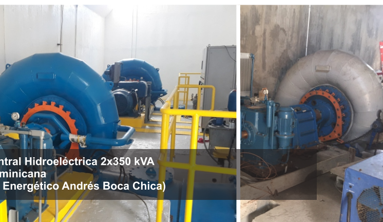
Mini Central Hidroeléctrica 2x350 kVA AES Dominicana (Parque Energético Andrés Boca Chica)