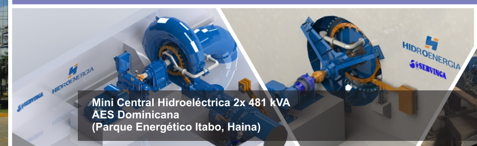
Mini Central Hidroeléctrica 2x 481 kVA AES Dominicana (Parque Energético Itabo, Haina)