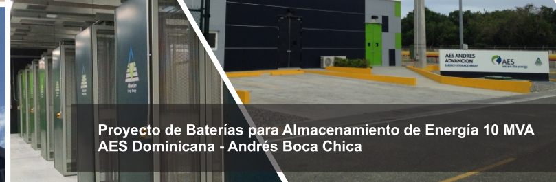
Proyecto de Baterías para Almacenamiento de Energía 10 MVA AES Dominicana - Andrés Boca Chica