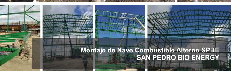
Montaje de Nave Combustible Alterno SPBE SAN PEDRO BIO ENERGY