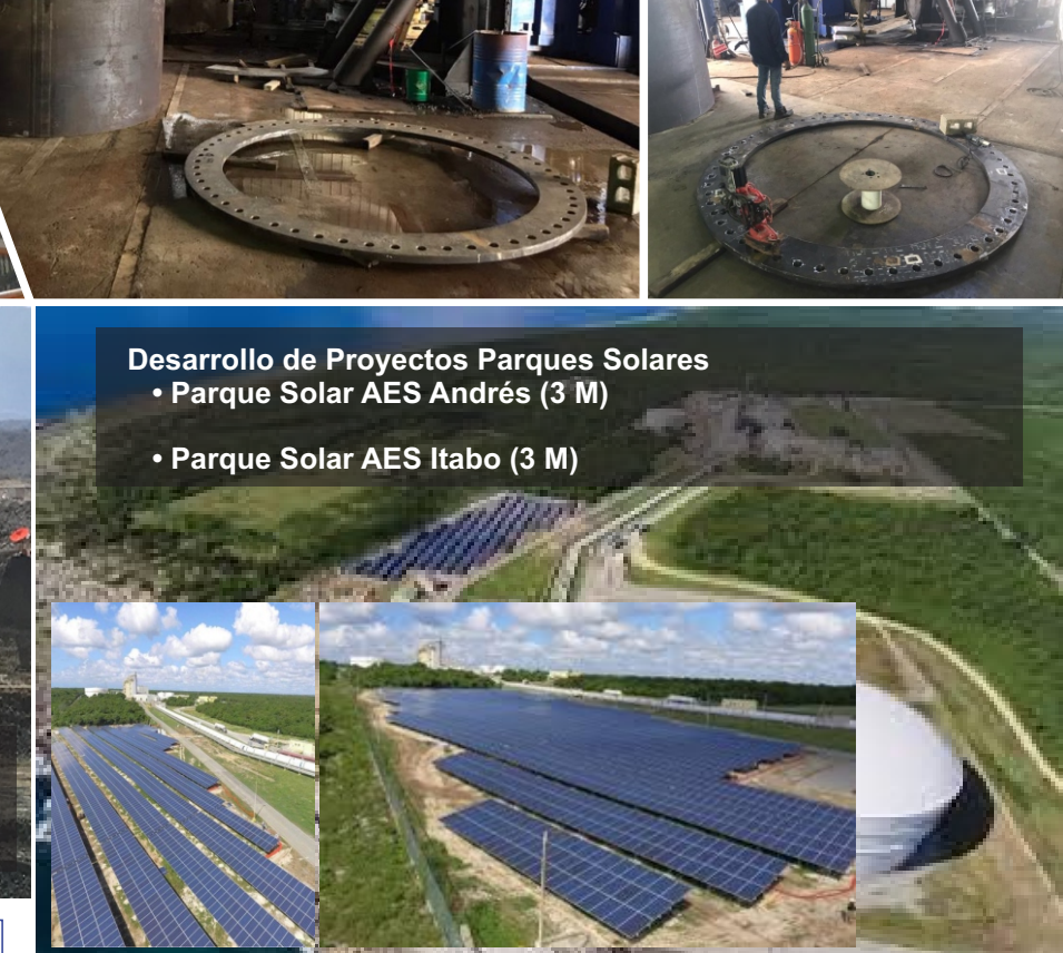
Desarrollo de Proyectos Parques Solares • Parque Solar AES Andrés (3 M) • Parque Solar AES Itabo (3 M)