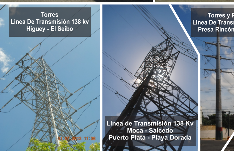
Torres Línea De Transmisión 138 kv Higüey - El Seibo