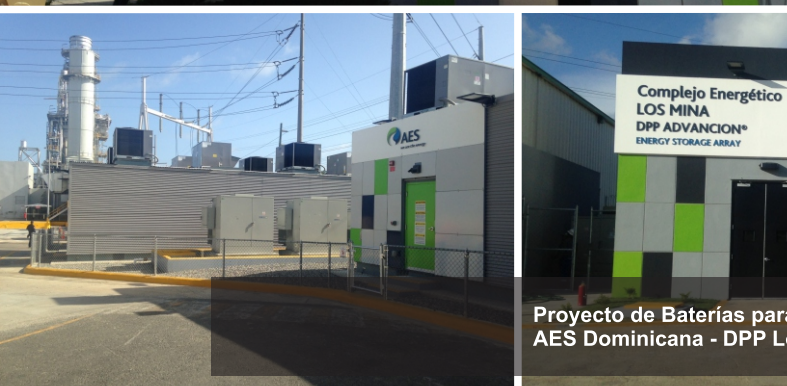
Complejo Energético LOS MINA DPP ADVANTAGE ENERGY STORAGE