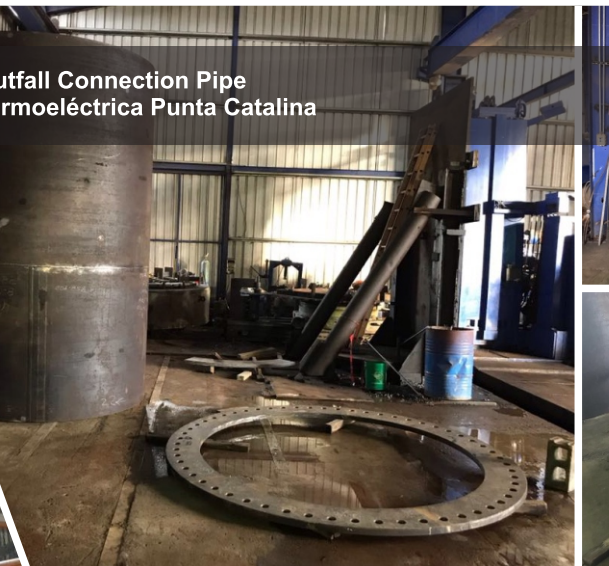
Outfall Connection Pipe Termoelectrica Punta Catalina