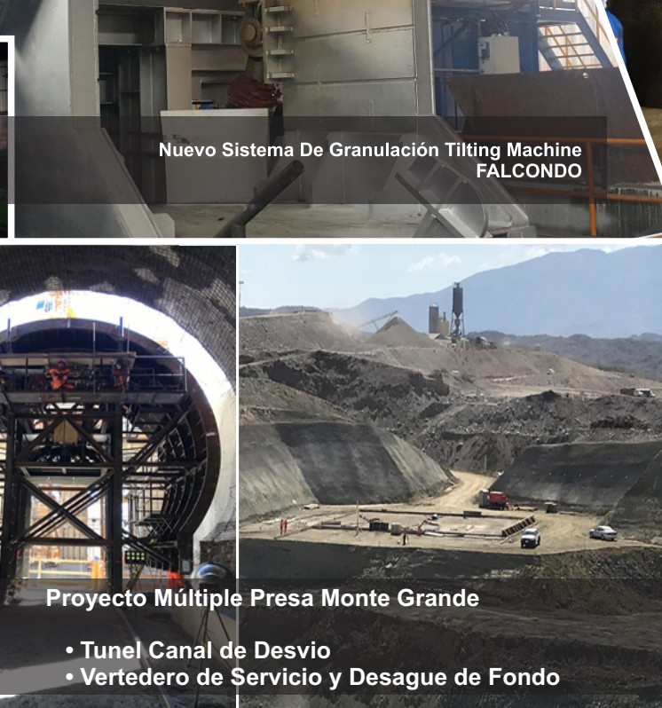
Proyecto Múltiple Presa Monte Grande • Tunel Canal de Desvío • Vertedero de Servicio y Desague de Fondo