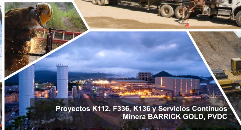
Proyectos K112, F336, K136 y Servicios Continuos Minera BARRICK GOLD, PVDC