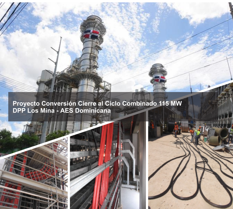
Proyecto Conversión Cierre al Ciclo Combinado 115 MW DPP Los Mina - AES Dominicana