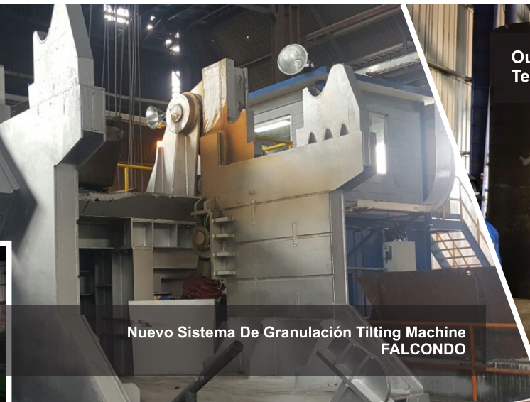
Nuevo Sistema De Granulación Tilting Machine FALCONDO