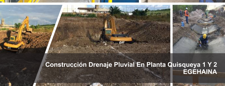
Construcción Drenaje Pluvial En Planta Quisqueya 1 Y 2 EGEHAIA