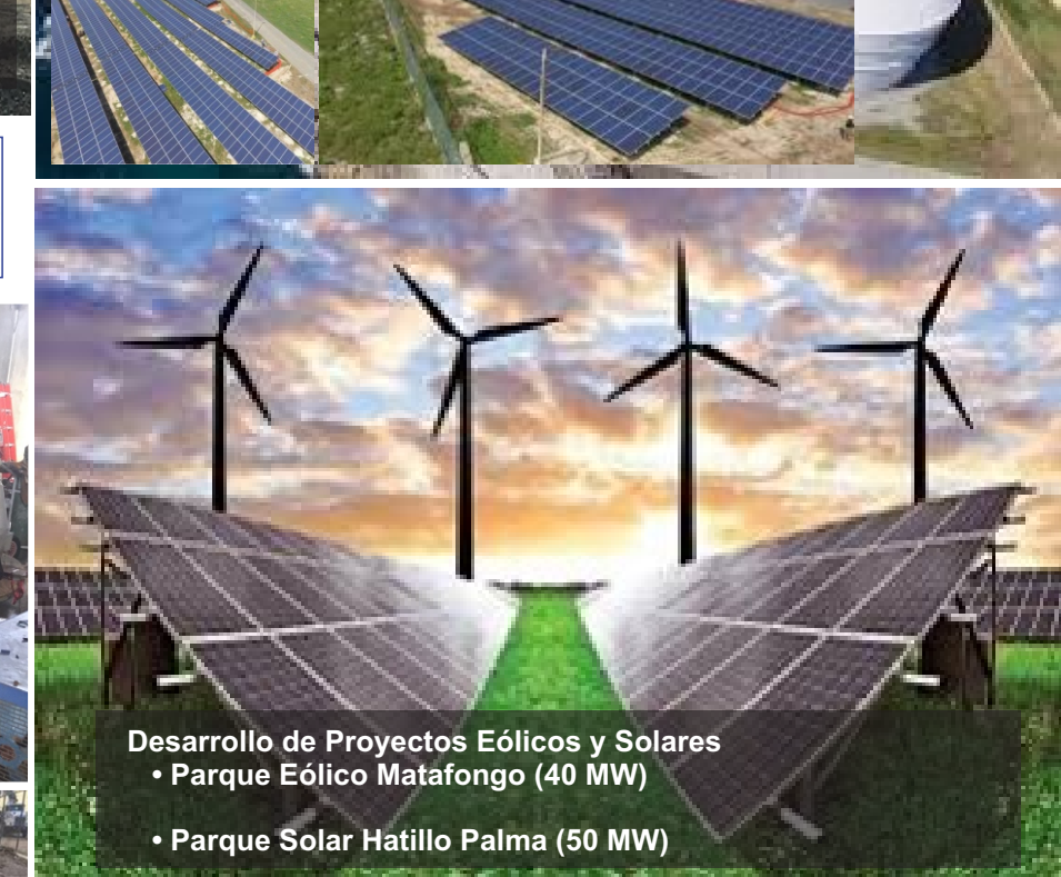
Desarrollo de Proyectos Eólicos y Solares • Parque Eólico Matafongo (40 MW) • Parque Solar Hatillo Palma (50 MW)