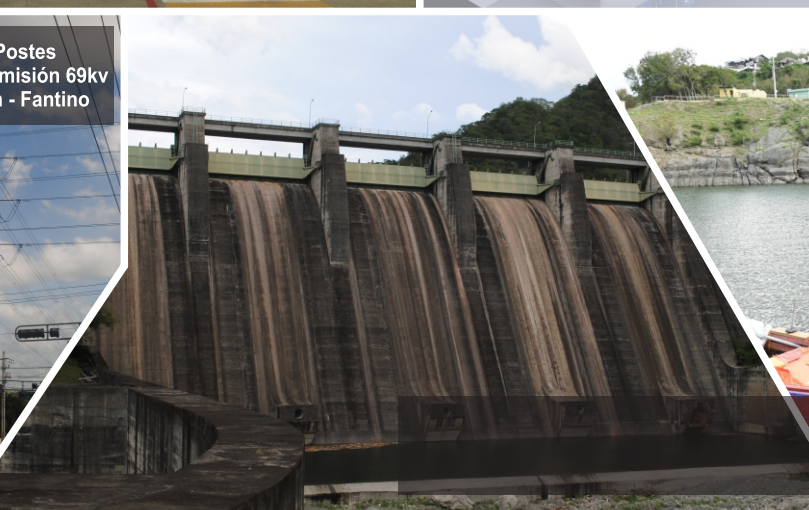
Torres y Postes Línea De Transmisión 69kv Presa Rincón - Fantino